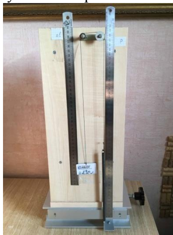
Самодельная разрывная машина

Цель настоящей работы: исследовать пакеты с маркировкой «эко» или «биоразлагаемые» различных торговых сетей России и Европы на соответствие заявленным свойствам, установить, есть ли резон экологически ответственному покупателю переплачивать за заявленную производителем «экологичность» пакета.